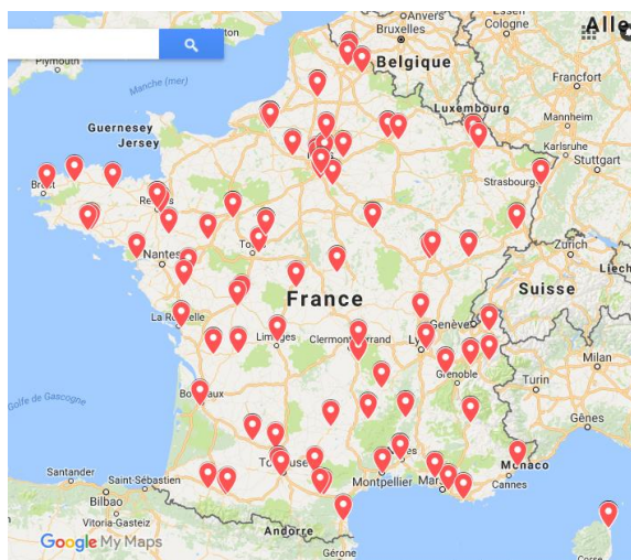
Carte des agences de collecte 2018-2020

Note. L'appel d'offre réalisé en 2017 pour la période 2018-2020 a permis de sélectionner une 100aine d'agences de collecte (hors DROM-COM).