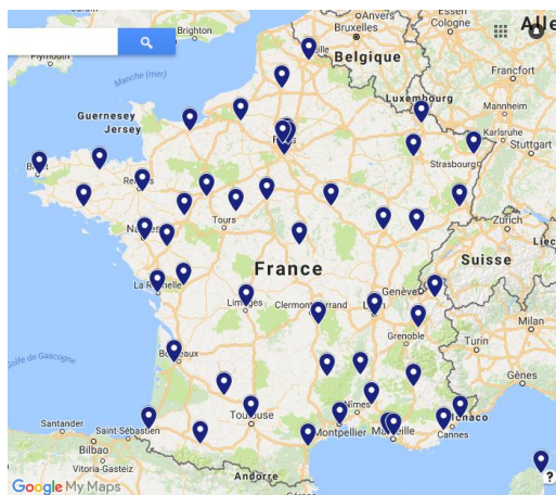
Carte des centres de traitement 2018-2020