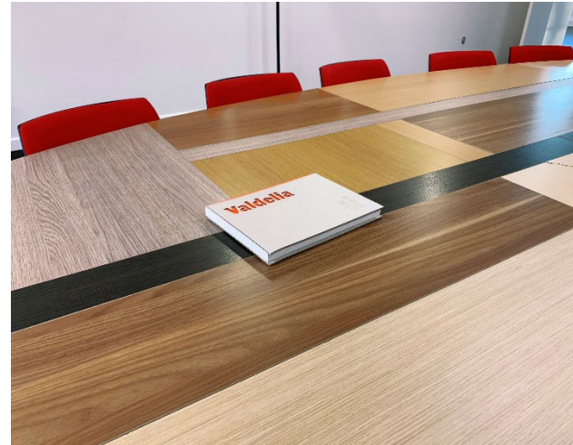
03 | Les règles d'utilisation