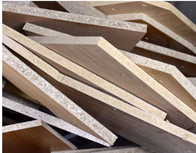
02 | La signalétique de tri