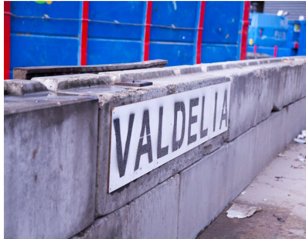
01 | La réglementation